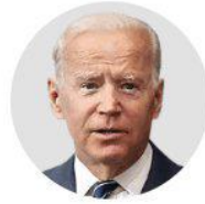
Joseph R. Biden Jr.