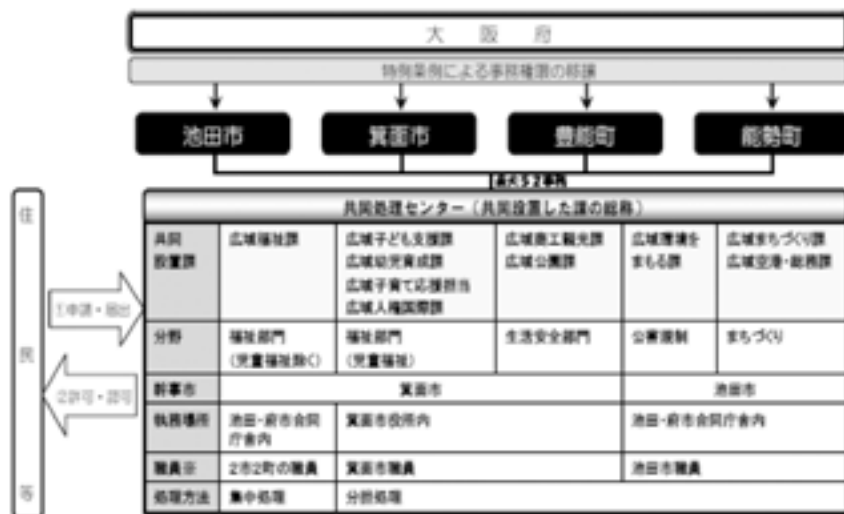
図1 「豊能地区共同処理センター」 (34)

保つことができる、また、別で議会を設置する必要もない。あくまで試算だが、単独で移譲を受けた場合より、職員14人分の減、約1億2千万円の効果が生まれるのではないかと報告されている。法改正を先取りする形で、事務移譲の受け皿を準備し、隣接の体力ある市が小規模の町の事務を支援し、職員同士の交流、意識改革にもつながる効果のある取り組みが評価されたといえる。