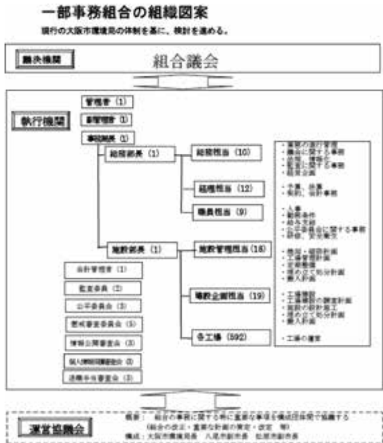
図2 「ごみ焼却施設一部事務組合の組織図案」

理事業の共同処理への協議が開始される。3市の関係をみると、松原市は大阪市の南西部に隣接しているが、2002年松原市立の焼却工場が老朽化で閉鎖され、建て替えまでの暫定措置として大阪市と協定し、市域のごみ処理を委託してきた。八尾市は南東部に隣接するが、大阪市との行政協力協定に基づき建設された大阪市環境局八尾工場 (49) を八尾市の焼却工場として利用してきた。すでに大阪市との協定により実際のごみ処理は行われており、2013年3月に基本合意書を締結、同10月に一部事務組合理約とごみ処理事業の承継に関する協定について合意し、3市の議会手続きに入る段階にある。しかし、既存の共同処理制度が「迅速な意思決定」に課題があると回答されていたように、一部事務組合は、特別地方公共団体であり、議会承認によるあらたな組合設立の手続きが必要であり、それだけでなく図2のようにガバナンスのための組合議会の設置（今回の協定で議員数は大阪市10人、八尾市2人、松原市2人）も必ずおこなわなければならない。くわえて議員の選任、監査委員会や公平委員会の設置、その他附属機関として懲戒審査、情報公開、個人情報保護、退職手当の各審査会などその手続きはハードルが高い。連携協約のような簡便な制度がこのような状況を補完するのではないかと痛感している。