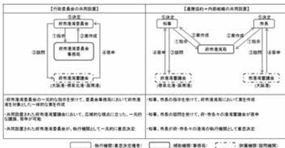
図3 「府市の港湾管理に関する業務 比較フロー」

て、管轄の自治体から独立して港湾一体の管理運営ができる機動的柔軟な制度への改正を国に求めるとされた。しかし、2014年8月に開かれた府市統合本部戦略会議では、港務局制度の改正の機運が熟さず、現行制度では困難との検討結果がでる。第30次答申の連携協約も検討されたが、意思決定に知事市長の権限が残ることから、より最善の策として行政委員会の設置という方針が決められた。全国の港湾管理者の状況は、166港のうち都道府県39市町村120港務局1（新居浜港）一部事務組合6（名古屋港管理組合、四日市管理組合、境港管理組合など） (57) となっている。港湾の広域的な組織としては、京浜港連携協議会（東京都、横浜市、川崎市）が2009年12月に地方自治法に基づく協議会として設置されている。ニューヨークのようなポートオーソリティをめざし、港務局制度の改正で対応を考えたが至らず、協議会よりも独立性が高い行政委員会の共同設置の手法で府市港湾の共同管理をすすめるとした。専門性の高い委員6人が港湾の管理を担う案であるが、実際のところ管理者は一元化せず、予算以外の通常の港湾法12条の管理業務について行政委員会が共同管理することになる。