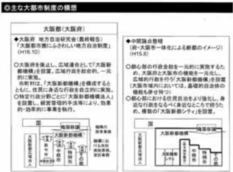
図5 「大阪新都機構の構想」